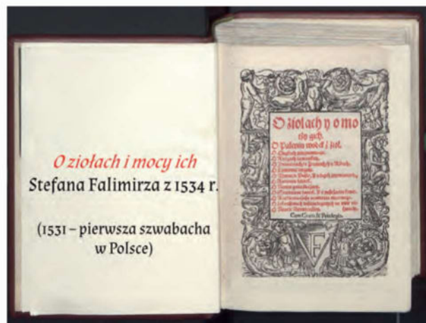
O ziołach i mocy ich Stefana Falimirza z 1534 r.

W zajęciach wykorzystujemy prezentację multimedialną, materiały filmowe i interaktywny quiz.